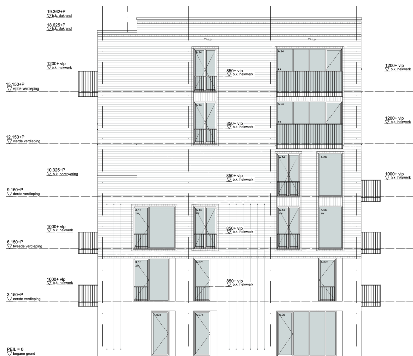
Figuur 1 Zuidoostgevel waarin alle soorten gevelopeningen met vloerafscheidingen zichtbaar zijn.

In de gevels van een nieuw te bouwen woongebouw worden Franse balkons toegepast. Een deel van de nieuwbouw bestaat uit een tot woonfunctie herbestemd gedeelte van een bestaand gebouw. Ook hierin worden Franse balkons toegepast. De hoogste vloer ligt op ruim 15 meter hoogte. In figuur 1 hieronder, is een kenmerkende gevel afgebeeld waarin alle in het gebouw voorkomende gevelopeningen met vloerafscheidingen in het gebouw zichtbaar zijn.