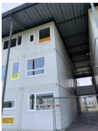
Figuur 1 Schildakconstructie vanuit de gevel bezien, uit Rapport brandweer, afb. 3.10